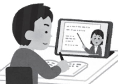
オンライン学習の実施に備え環境整備の推進を