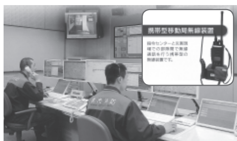
談合があったとして提訴に踏み切る

議員 全国の自治体が発注した消防救急デジタル無線の入札では、談合が繰り返されたとして、公正取引委員会は2017年、自主申告した事業者を除くメーカー4社に総額63億4490万円の課徴金納付を命じた。本市においての納入では、一般競争入札により1億4910万円で、三峰無線株式会社と契約し、沖電気製品が納入され運用を開始した。この沖電気は談合メーカーのうちの1社であった。私は、これが「代理店」を使った談合なのではないか