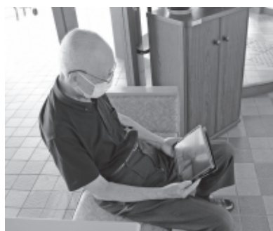
感染防止のためタブレットでオンライン面会を実施（蕨サンクチュアリ）

市長 小規模企業者、ひとり親家庭、妊娠中の方、医療機関等への支援を行うとともに、よ