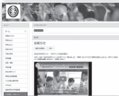
中央東小のホームページ

中央東小のホームページには、学習動画の配信状況や、各学校の取り組みが紹介されている。また、学習動画の配信状況や、各学校の取り組みが紹介されている。