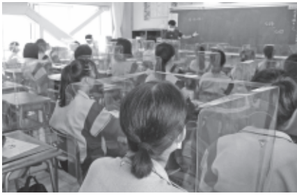
学校で使用している飛沫飛散防止のパーテーション

の低下が心配される。状況に応じて体育の授業中に保護者の参観が可能な球技大会の実施などを工夫する。また、「わかる・できる・楽しい」を実感できる魅力ある授業が提供できるよう、学年や教科ごとに授業づくりを考えたい。