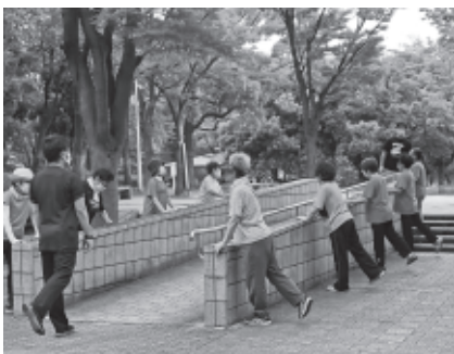
コロナ禍で施設が利用できなくても知恵を絞って屋外でのいきいき百歳体操

議員 体操教室の中止や自粛生活で、要支援や要介護状態をつくらないことが急務であり、そのための知恵を市民とともに考えていただきたい。