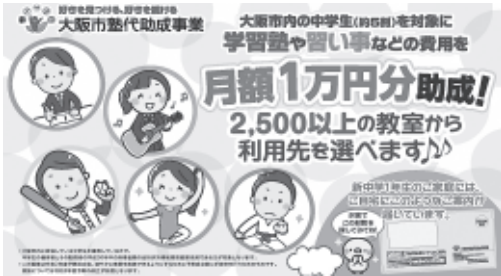
大阪市で実施している塾代助成事業

議員 10万円の給付が遅れた理由は、国がマイナンバーカードを中途半端に活用したこと、マイナンバーを使用しているの給付が可能になる法律を制定できていないこと。国へマイナンバー制度の適用拡大