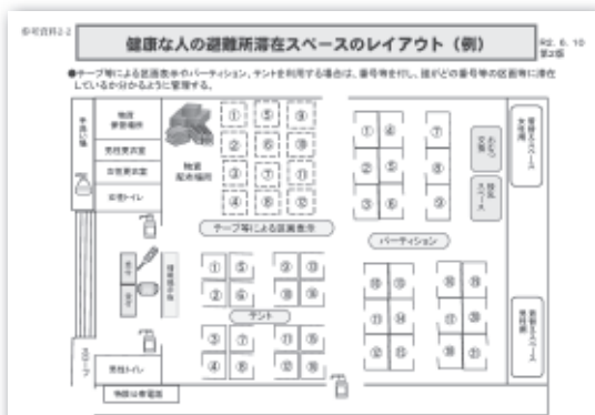
感染症発生時における避難所レイアウトの例

健康福祉部長 保健センターでは、6月1日現在、サージカルマスク750枚、100枚入りビニール手袋41箱、フェイスマスク144枚などを備蓄している。