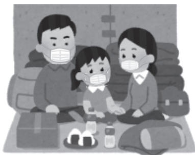
自然災害のシーズンを前に、避難所で感染症が広まらないようにしよう