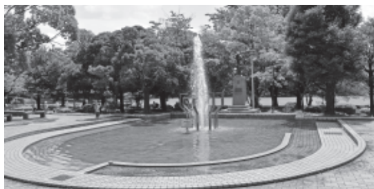
より市民に親しまれるような公園の整備を（蕨市民公園）

議員 市民公園のランニングコースは、土手の周りの木が茂り、見通しが悪く、特に夜間は非常に危ないと市民から不安の声がある。私自身も夜に歩いてみたが、昼間は何とか歩けるが、夜間は非常に危ない状況もある。私自身も夜に歩いてみたが、昼間は何とか歩けるが、夜間は非常に危ない状況もある。私自身も夜に歩いてみたが、昼間は何とか歩けるが、夜間は非常に危ない状況もある。